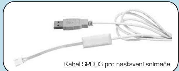
Kabel SPO03 pro nastavení snímače

Výstup je výrobcem nastaven na rozsah 800-1100hPa. Rozsah je uživatelsky nastavitelný z osobního počítače pomocí kabelu SPO03, který se dodává jako příslušenství za příplatek - viz níže. Pokud je požadováno jiné nastavení než standardní, uveďte prosím požadovaný rozsah. Snímač umožňuje měření tlaku přepočítaného na hladinu moře nastavením korekce na nadmořskou výšku.